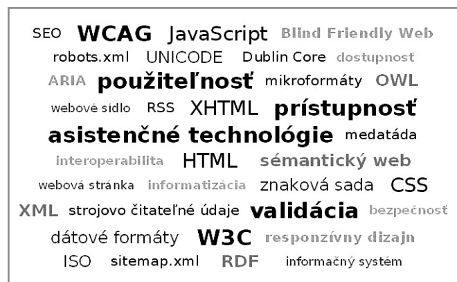
Obr. 1. Výber termínov súvisiacich s pravidlami a štandardmi pre web

Problematika štandardov a pravidiel pre web je veľmi široká (na obrázku 1 je výber termínov, s ktorými sa v súvislosti s nimi stretávame). Vo všeobecnosti ide o súbory odporúčaní, ktoré upravujú technológie na tvorbu webu a technológie na prezentáciu obsahu na webe.